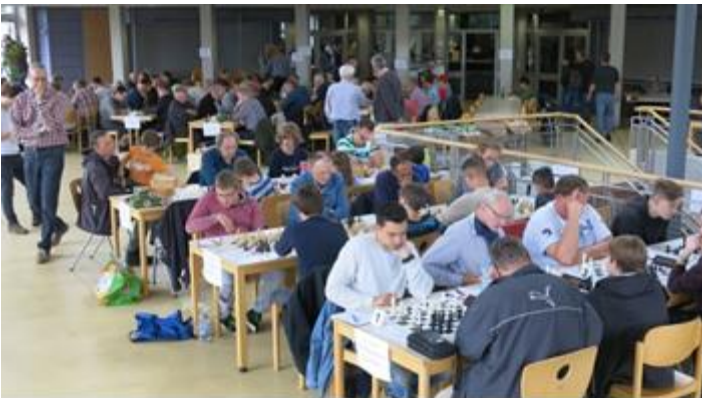
Mensa Gesamtschule Brand

Der Spieltag selbst ging gut über die Bühne. Es gab erfreulicher wenig freigelassene Bretter. Lediglich